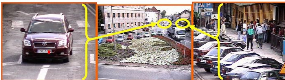
kierunek ul. Dworcowej