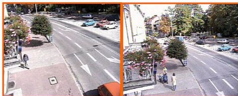
kierunek ul. Piątego Stycznia