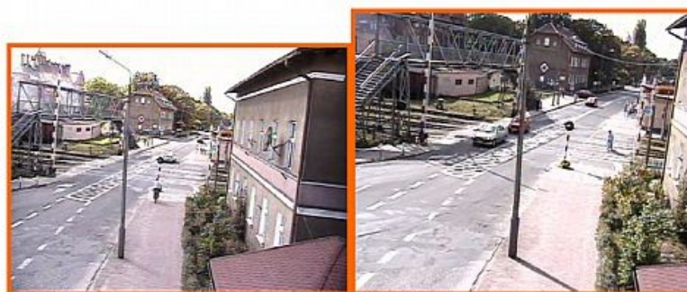
kierunek ul. Poniatowskiego